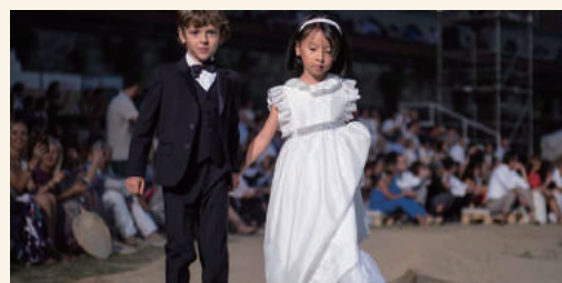
ファッションショー