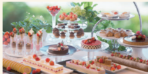
デザートビュッフェ ※写真はイメージです

振付作品は、新国立劇場（日本）、Royal Flanders Ballet（ベルギー）、Hubbard Street Dance Chicago（アメリカ）、Colorado Ballet（アメリカ）、Grand Theater de Geneve（スイス）、Introdans（オランダ）、Singapore dance theater（シンガポール）等をはじめ世界各国の著名な舞踊団のレパートリーになっている。宝塚歌劇団の「薔薇の封印」や「Never say good bye」、東宝ミュージカル「エリザベート」（2004年から2013年版）の振付やディズニーランドのショーの振付を担当するほか、カナダの世界的サーカス集団、シルク・ド・ソレイユ日本公演のキャスティング・パートナーでもある。