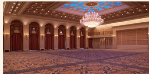
帝国ホテル大阪 エンパイアルーム