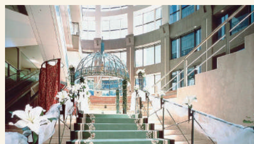
ホテルニューオータニ東京 アトリウムチャペル