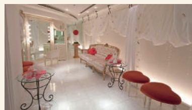
シンデレラルーム