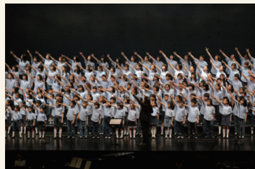
こどもの城合唱団